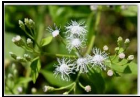
Gambar 1 Chromolaena odorata (L.).

Stachtarpheta jamaicensis atau nama indonesia pecut kuda (Gambar 2) mempunyai daun berwarna hijau sepanjang tahun di semua musim. Susunan daun terletak berhadapan. Memiliki bentuk daun oval dan bergerigi pada tepinya. Pada permukaan daun memiliki kerutan kasar seperti tekstur kulit jeruk. Tanaman ini berbunga sepanjang tahun, tetapi pada bulan desember sampai februari memiliki bunga yang lebih sedikit, bunga berwarna ungu dan ada pula yang berwarna ungu kebiruan. Letak kelopak bunga terdapat pada tangkai yang berwarna hijau dan memiliki sisik. Bunga terletak di tangkai dan bertumpuk. Kelopak bunga yang ganjil dan adanya mahkota bunga. Pada batang tanaman ini berkayu walaupun kecil. Semua permukaan batang berwarna hijau. Pecut kuda merupakan tanaman yang berasal dari daerah selatan Florida dan dikenal sebagai gulma di beberapa negara. Pecut kuda dapat mengganggu pertumbuhan tanaman lain yang dibudidayakan (Susilo, 2018).