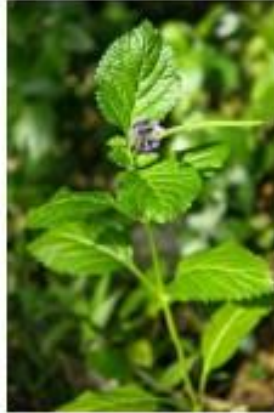
Gambar 2 Stachytarpheta jamaicensis .